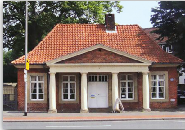
Domizil des Stadtheimatbundes: Das klassizistische Torhaus von 1778